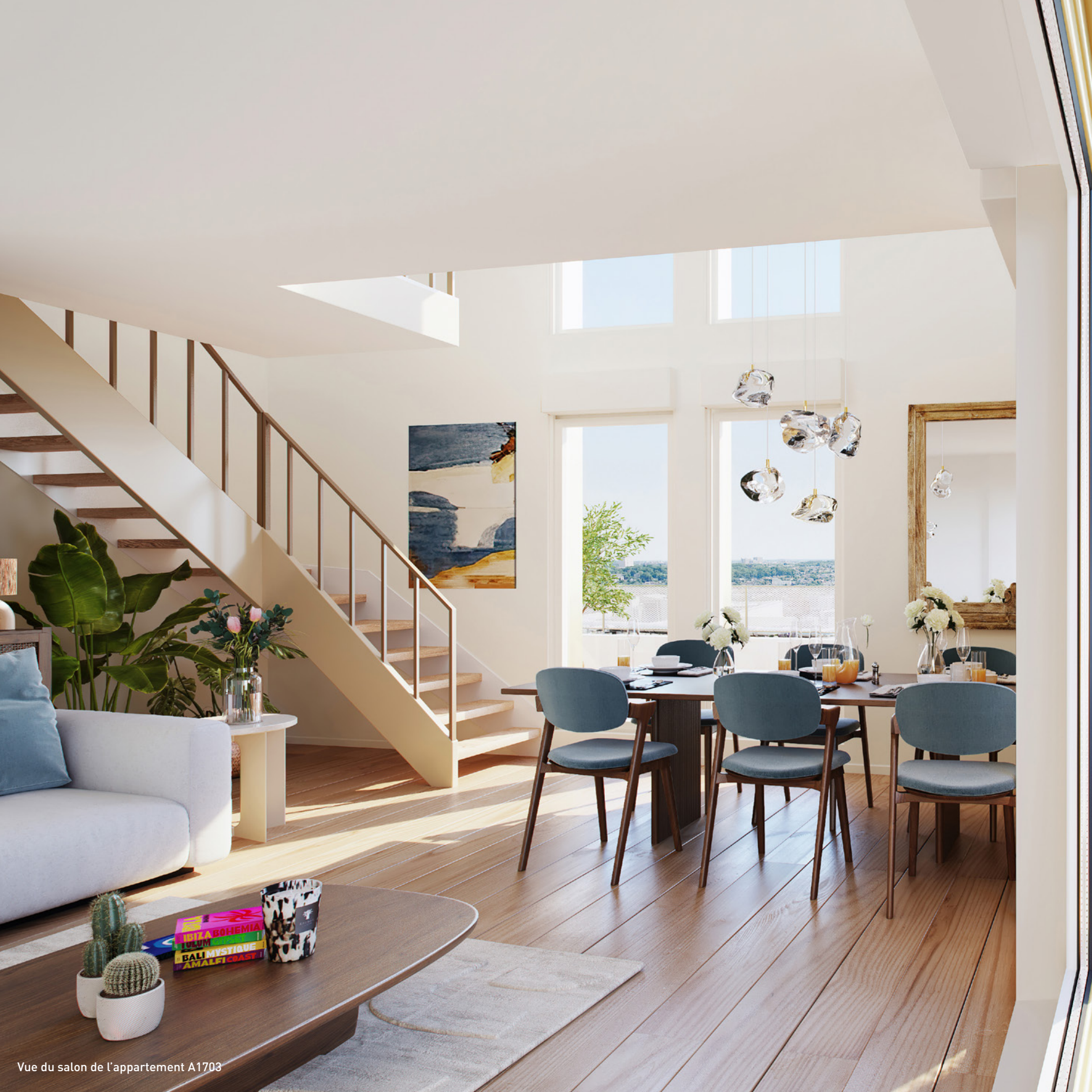
Vue du salon de l'appartement A1703