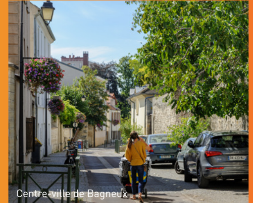
Centre-ville de Bagneux