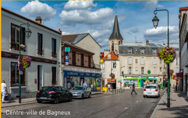
Centre-ville de Bagneux