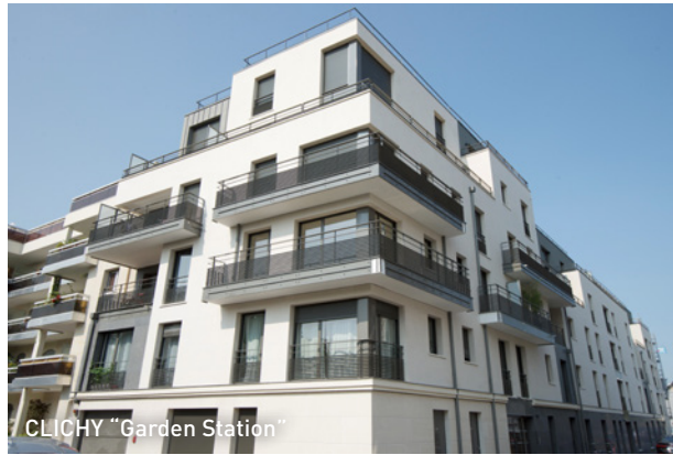
CLICHY "Garden Station"