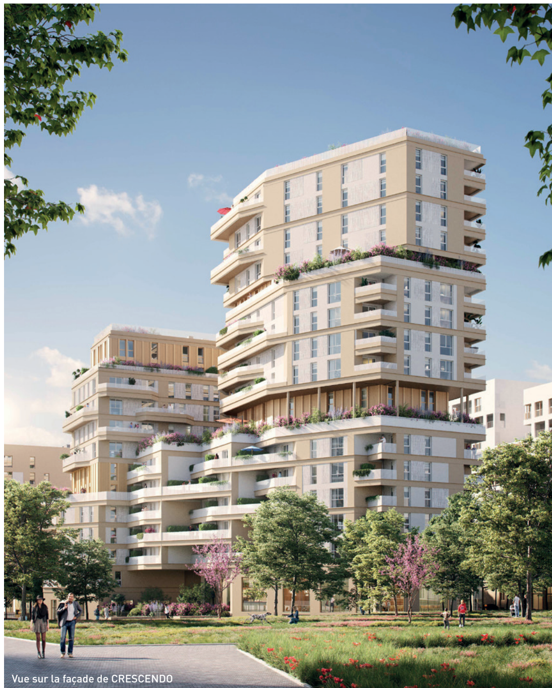
Vue sur la façade de CRESCENDO

O'Mathurins incarne le parfait équilibre entre la vie urbaine et la nature environnante. Avec ses 3 hectares de parcs et de jardins soigneusement aménagés, les résidents peuvent profiter de moments de détente en plein air, pratiquer des activités sportives ou tout simplement se ressourcer dans un cadre verdoyant.