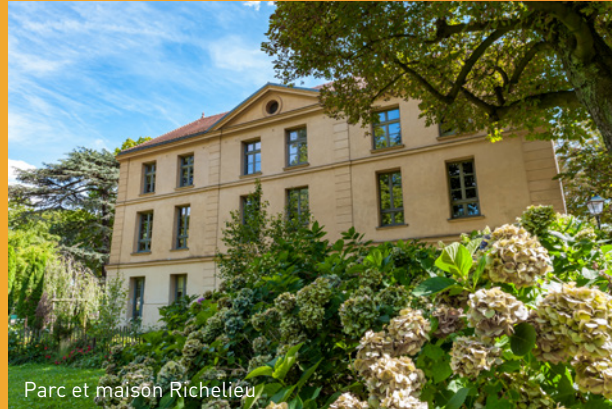
Parc et maison Richeliéu