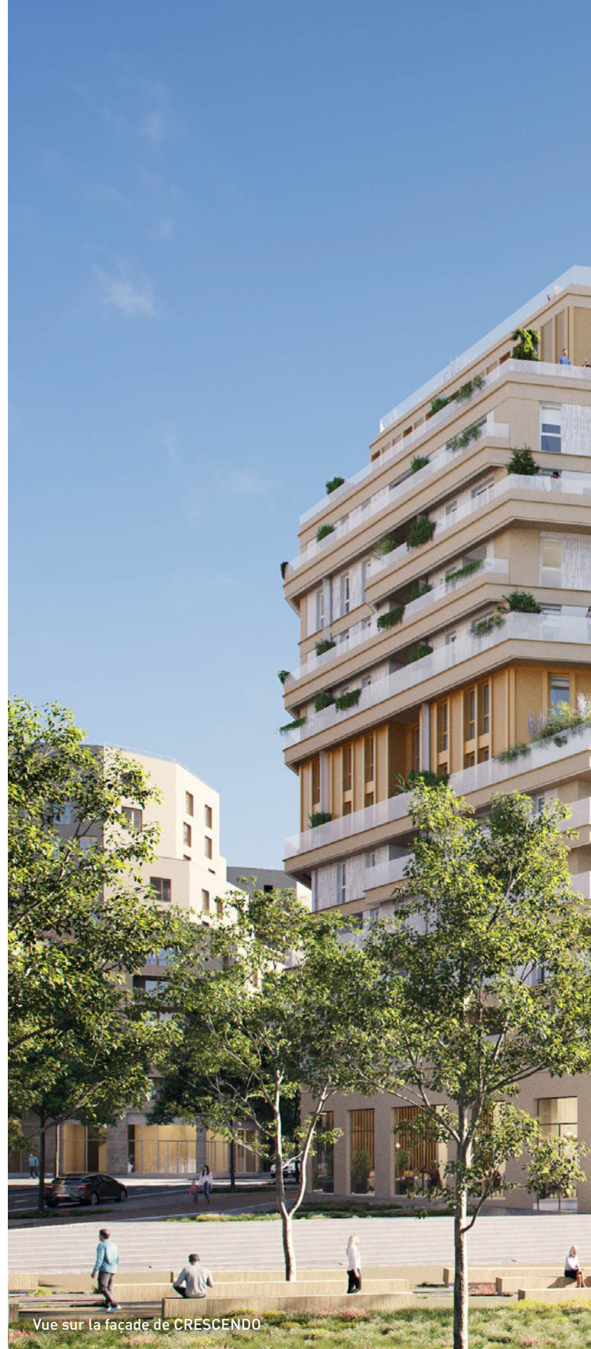
Vue sur la façade de CRESCENDO

Enfin, Crescendo offre un espace extérieur à ses appartements**. Ils profitent ainsi d'un jardin privatif, d'un balcon, d'une loggia ou d'une terrasse, prolongeant pour certaines, le séjour et l'ensemble des chambres.