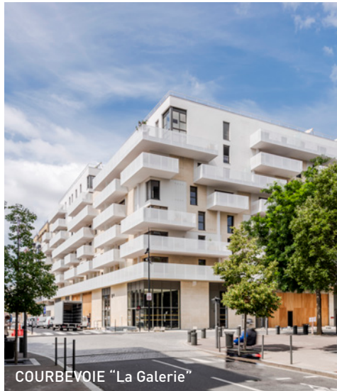
COURBEVOIE "La Galerie"