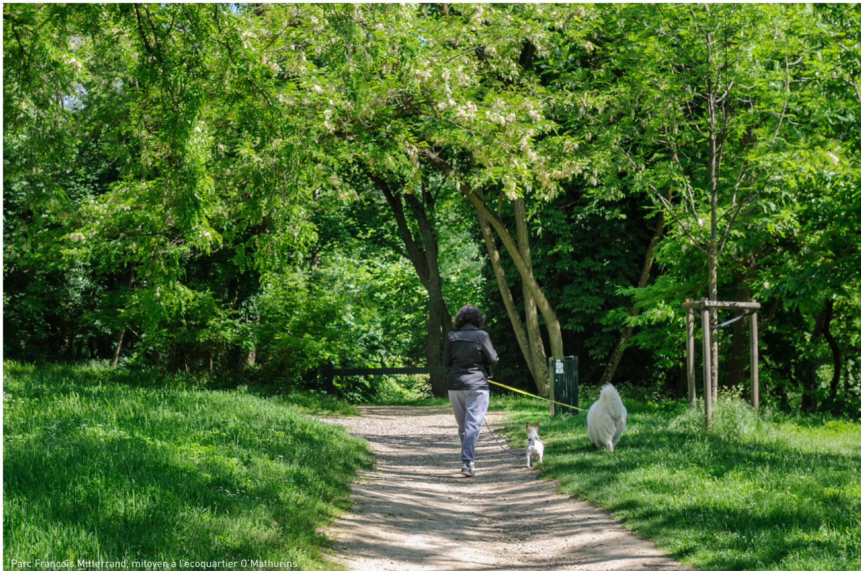
Parc François Mitterrand, mitoyen à l'écoquartier O'Mathurins