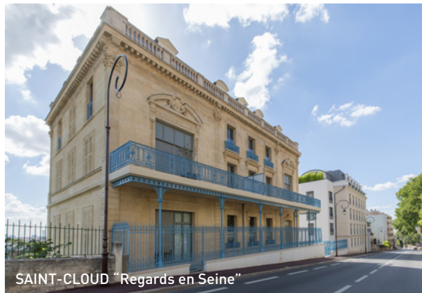
SAINT-CLOUD "Regards en Seine"