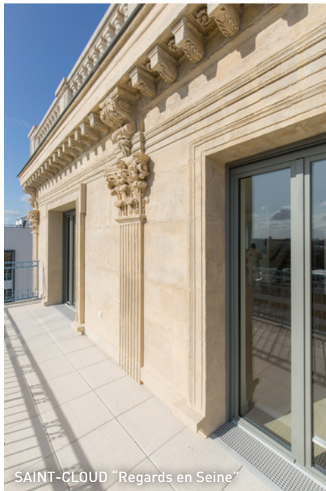
SAINT-CLOUD "Regards en Seine"