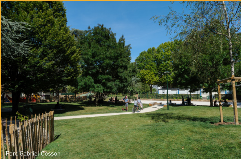
Parc Gabriel Cosson