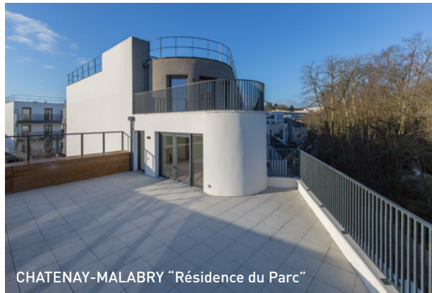
CHATENAY-MALABRY "Résidence du Parc"