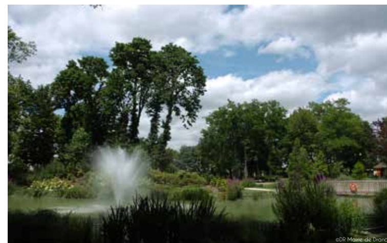
Parc du château de Ladoucette