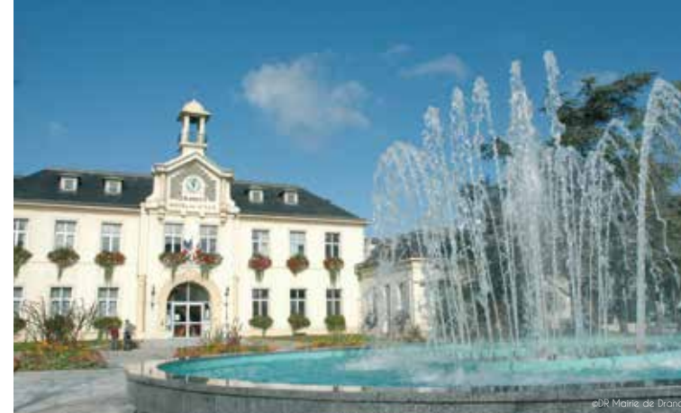
Mairie de Drancy

Drancy se transforme sous l'impulsion d'architectes inspirés. Ils imaginent le Drancy de demain, trait d'union réussi entre la ville d'hier et le vivre-ensemble d'aujourd'hui. Un véritable réaménagement urbain, renforcé par l'arrivée, dans les années à venir, de la ligne 15 Est (1) du Grand Paris, avec la création de la station « Drancy-Bobigny » qui facilitera tous les déplacements vers Paris.