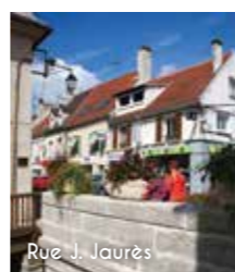
Rue J. Jaurès

Les commerces, les services ainsi que le marché sur la Place du Général de Gaulle facilitent le quotidien de toute la famille. Les 140 boutiques et restaurants du centre commercial « Les Sentiers de Claye-Souilly » complètent ces atouts. Côté nature, il est agréable de se promener le long des berges du Canal de l'Ourcq, sur les sentiers de la forêt régionale de Claye-Souilly ou au sein des parcs Buffon et Papillon de la Prée, en vélo, à pied, entre amis ou en famille.