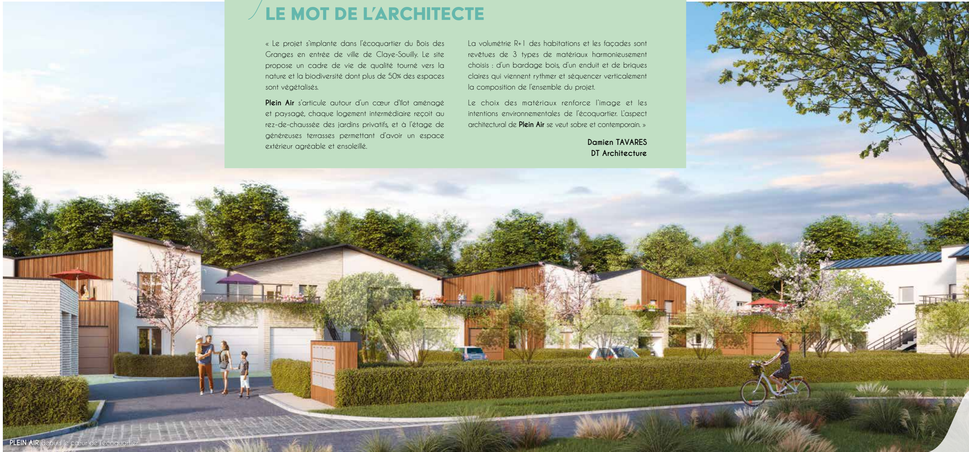
PLEIN AIR depuis le cœur de l'écoquartier

L'architecture présente des façades séquencées, dont les formes et les volumes s'inspirent des maisons individuelles. Elles alternent les matériaux de qualité pérenne : enduit blanc lumineux, briquettes de couleur blanche et parement en lames de bois. Les toitures en acier aspect zinc gris clair coiffent chaque ensemble avec élégance.