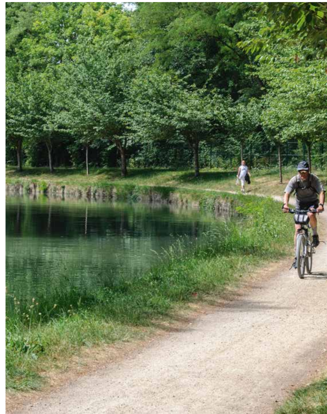
Les bords du canal de l'Ourcq

Située en lisière de Villeparisis et de Lagny-sur-Marne, à seulement 20 min de l'aéroport de Roissy-Charles-de-Gaulle et à 25 min du parc Disneyland® Paris, Claye-Souilly assure une douceur de vivre préservée, au plus proche des pôles d'emplois franciliens.