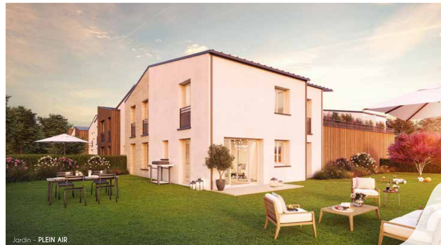
Jardin - PLEIN AIR

Ces espaces extérieurs, baignés de soleil, invitent à s'y installer... L'occasion de partager un moment convivial en famille ou s'accorder une pause détente en toute tranquillité. Aux étages, les terrasses plein-ciel s'étendent pour devenir une véritable pièce de vie à part entière où il fait bon de se retrouver.