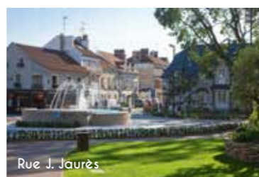
Rue J. Jaurès