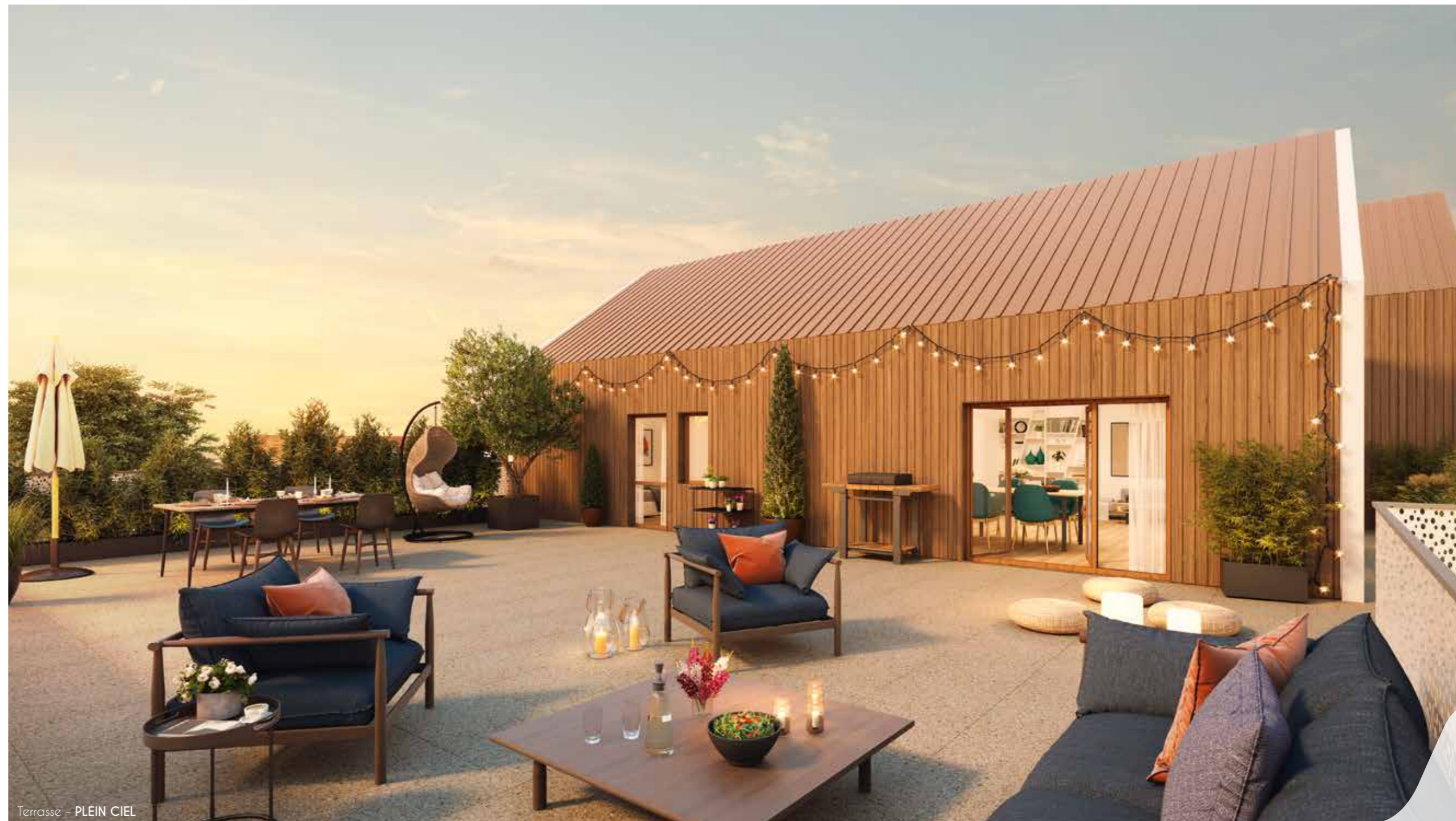
Terrasse - PLEIN CIEL

Illustration non contractuelle à caractère d'ambiance