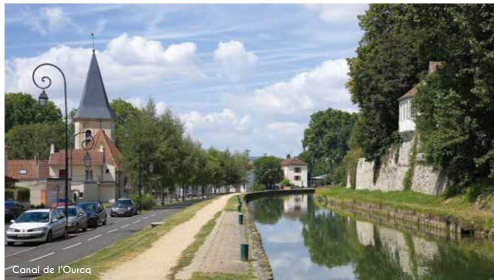
Canal de l'Ourcq