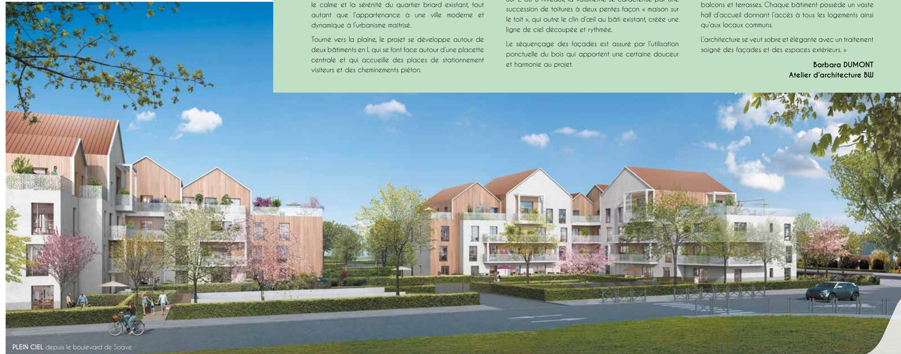
PLEIN CIEL depuis le boulevard de Soave

Barbara DUMONT Atelier d'architecture BW