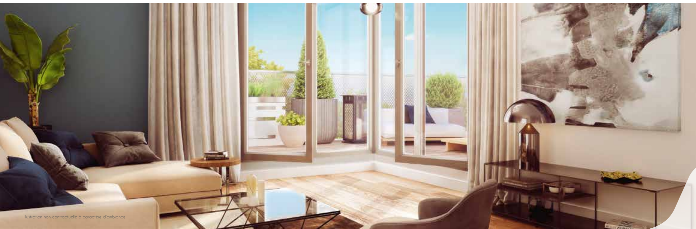
Illustration non contractuelle à caractère d'ambiance