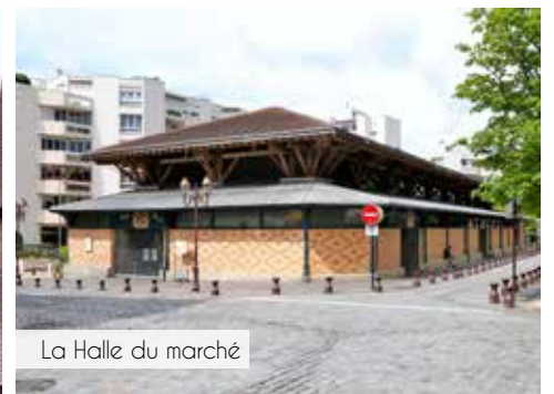
La Halle du marché