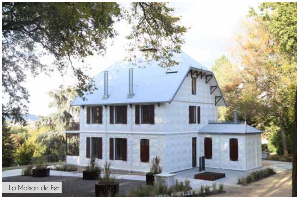
La Maison de Fer