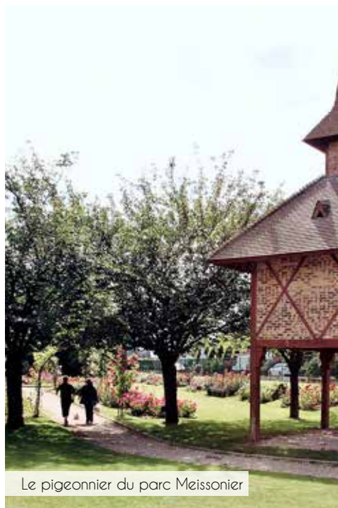
Le pigeonnier du parc Meissonnier