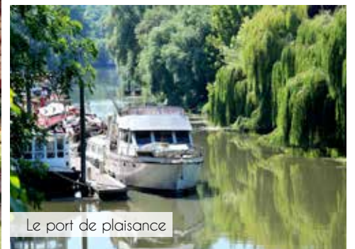
Le port de plaisance