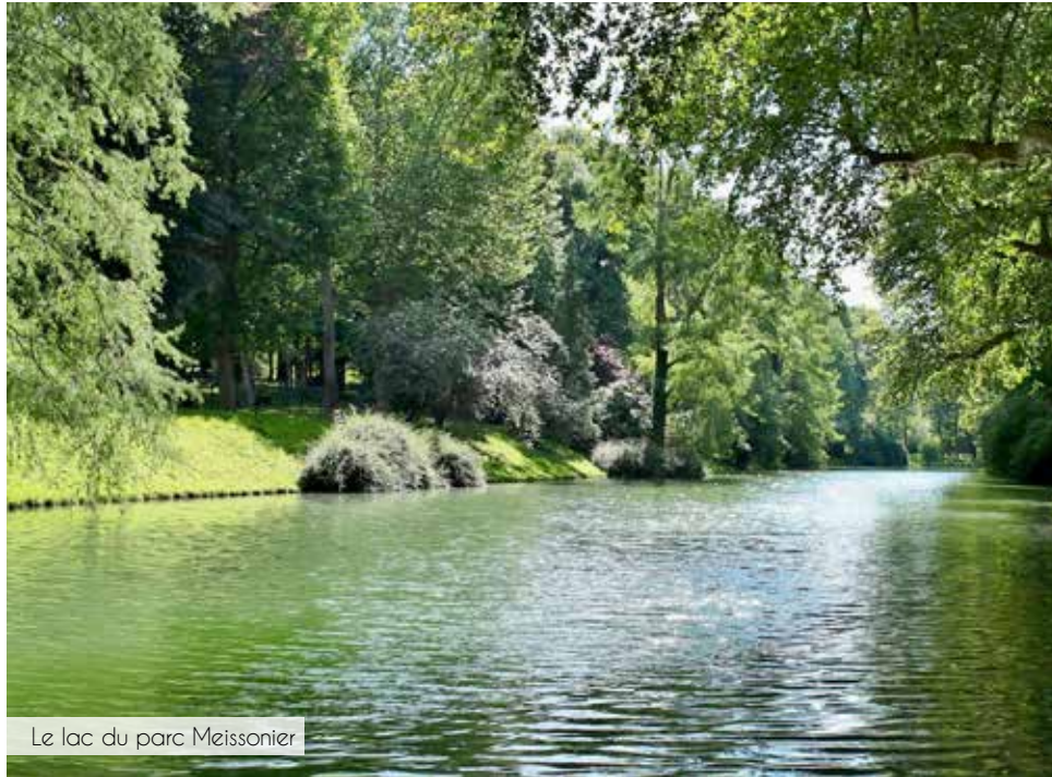
Le lac du parc Meissonnier