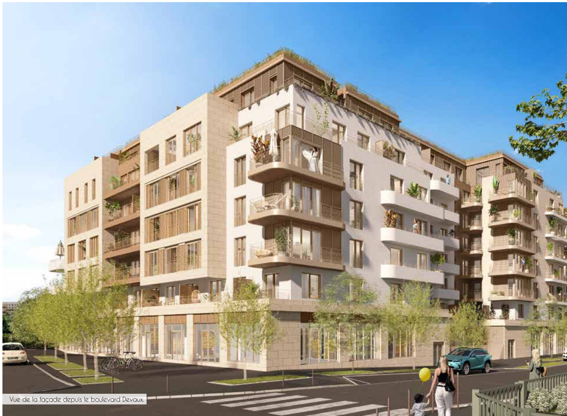
Vue de la façade depuis le boulevard Devaux.