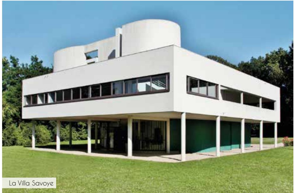
La Villa Savoye