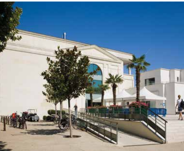
La piscine de Puteaux