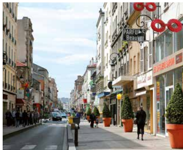
Rue Jean Jaurès