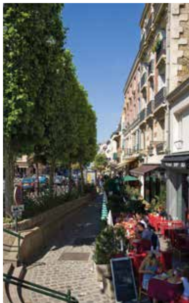
Le centre-ville historique