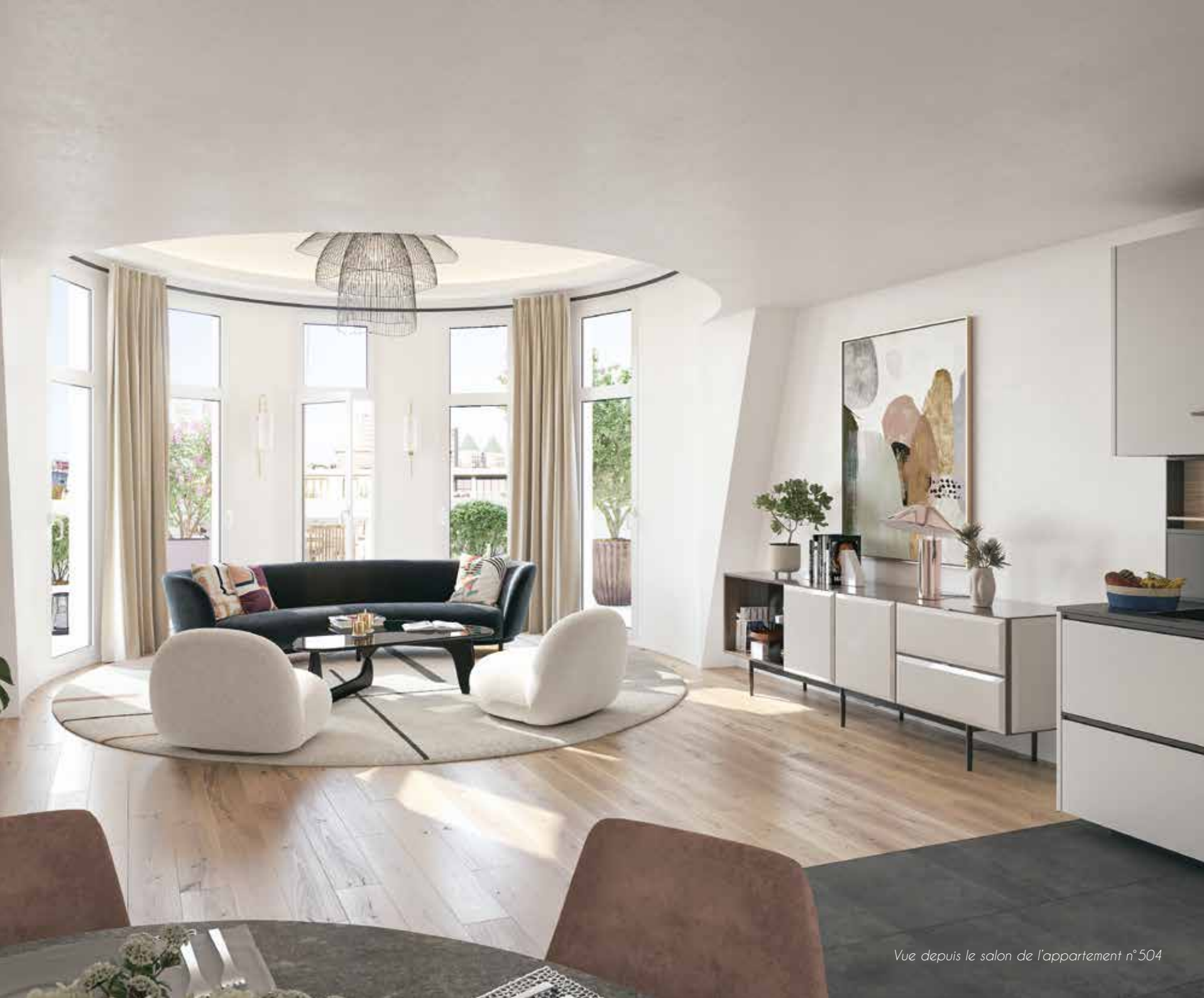
Vue depuis le salon de l'appartement n° 504