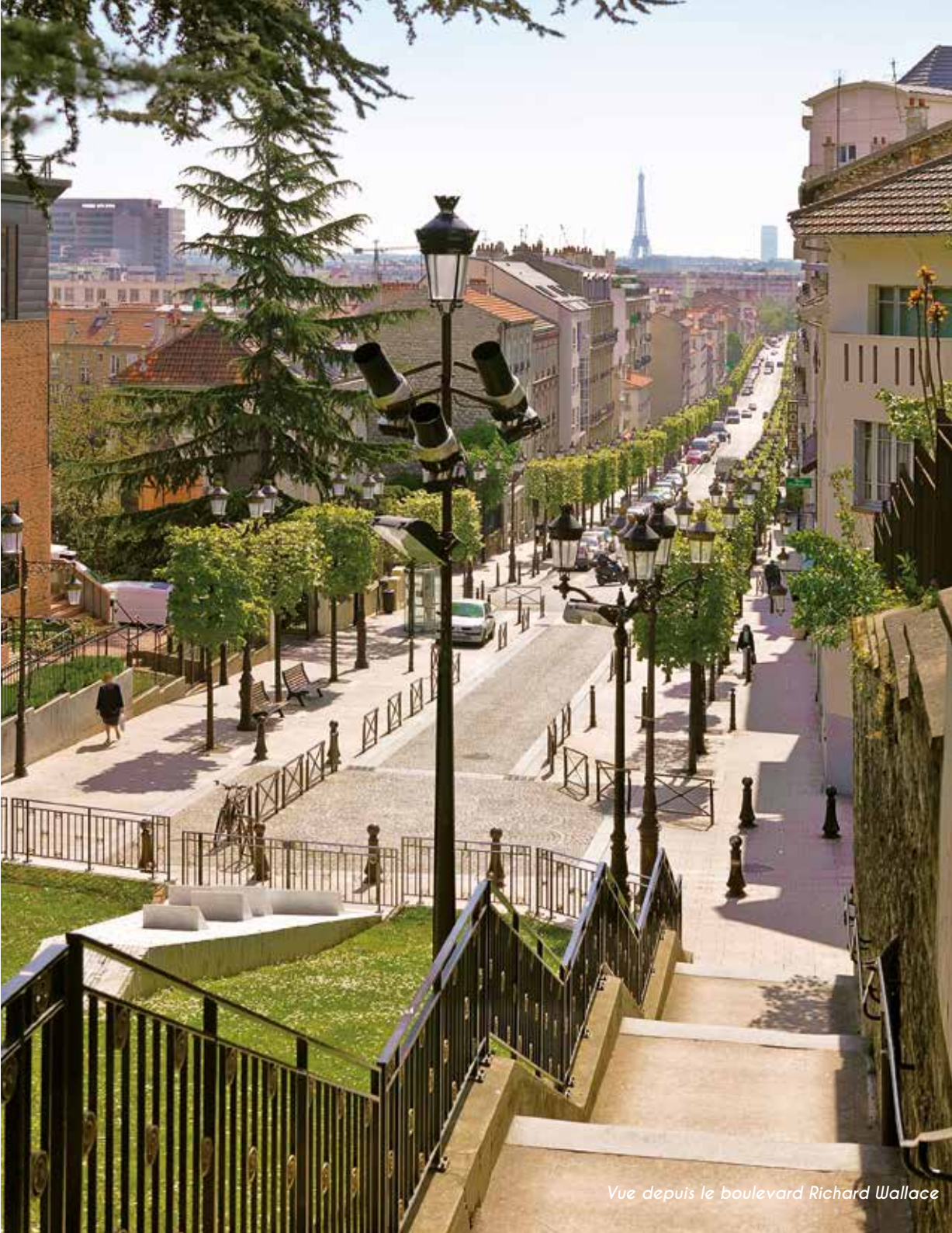
Vue depuis le boulevard Richard Wallace