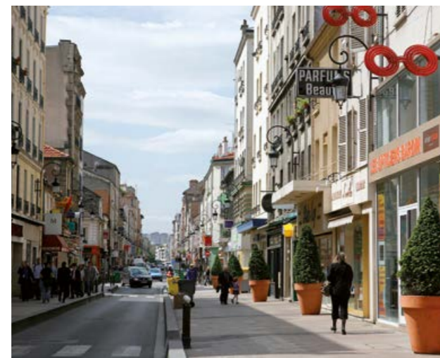
Rue Jean Jaurès