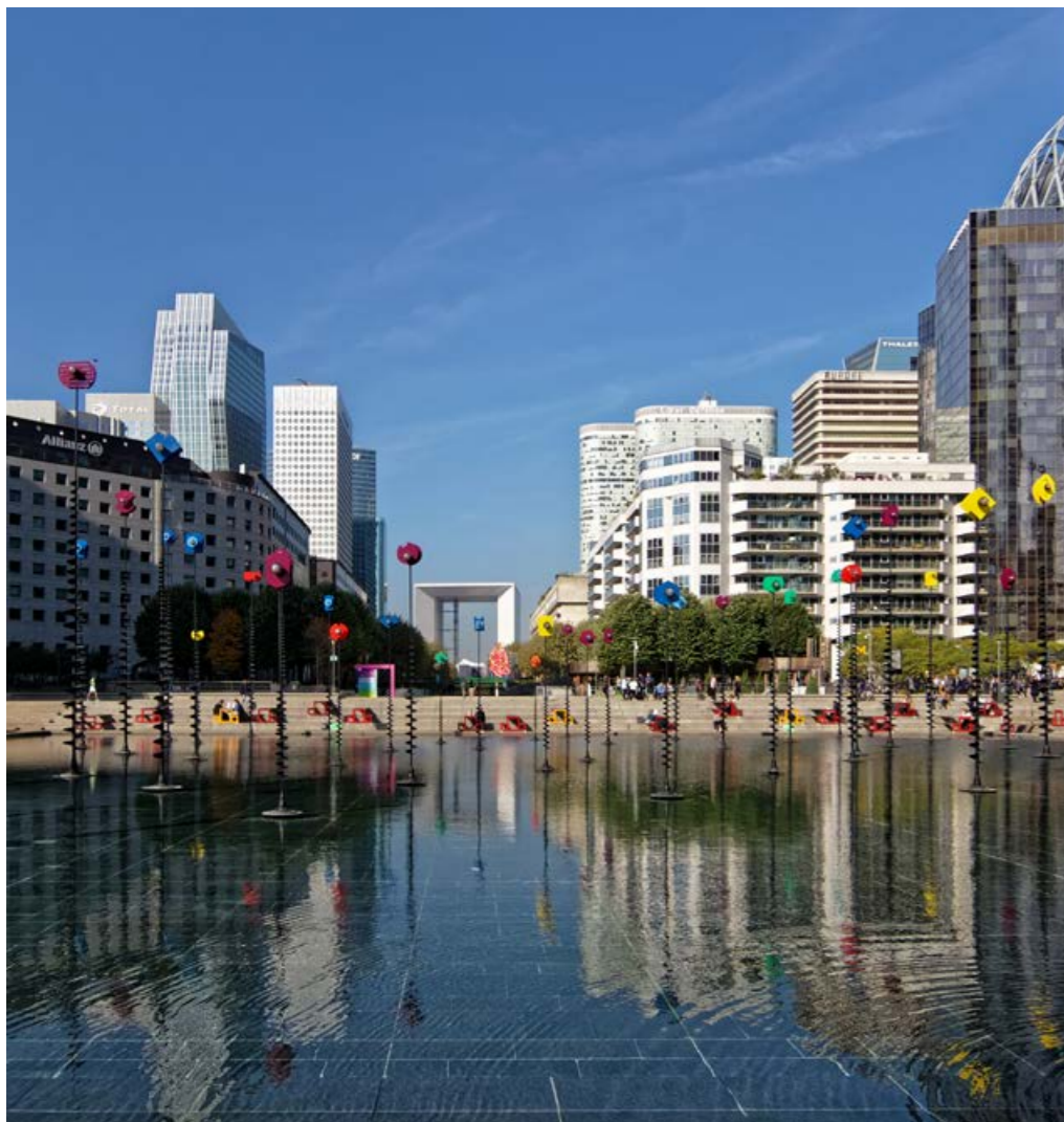
Parvis de l'esplanade de La Défense