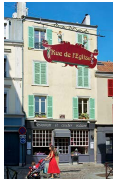
Le centre-ville historique