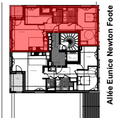
Allée Eunice Newton Foote