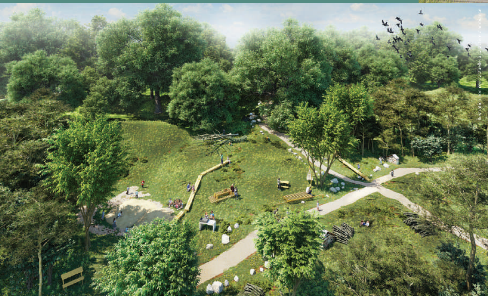
Illustration non contractuelle, à caractère d'ambiance.