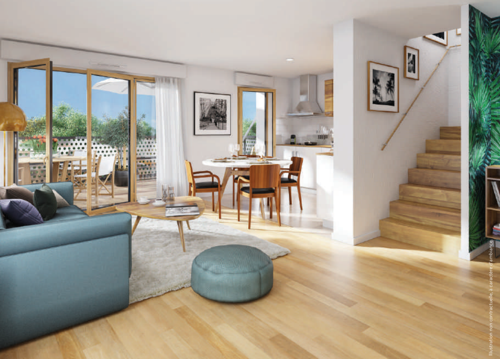
Illustration non contractuelle, à caractère d'ambiance.