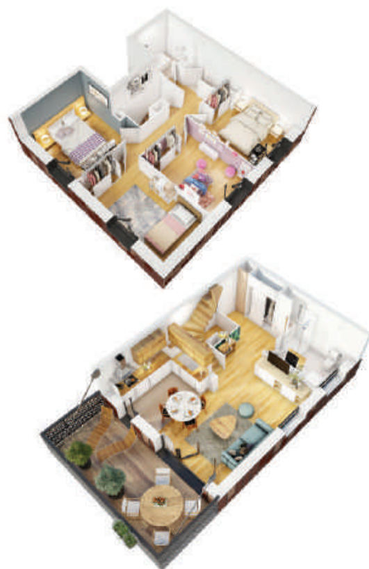
Appartement D42 - Illustrations non contractuelles, à caractère d'ambiance.

Vivre dans un duplex, c'est retrouver un sentiment d'indépendance un peu comme dans une maison... ....se recentrer sur la sphère familiale.