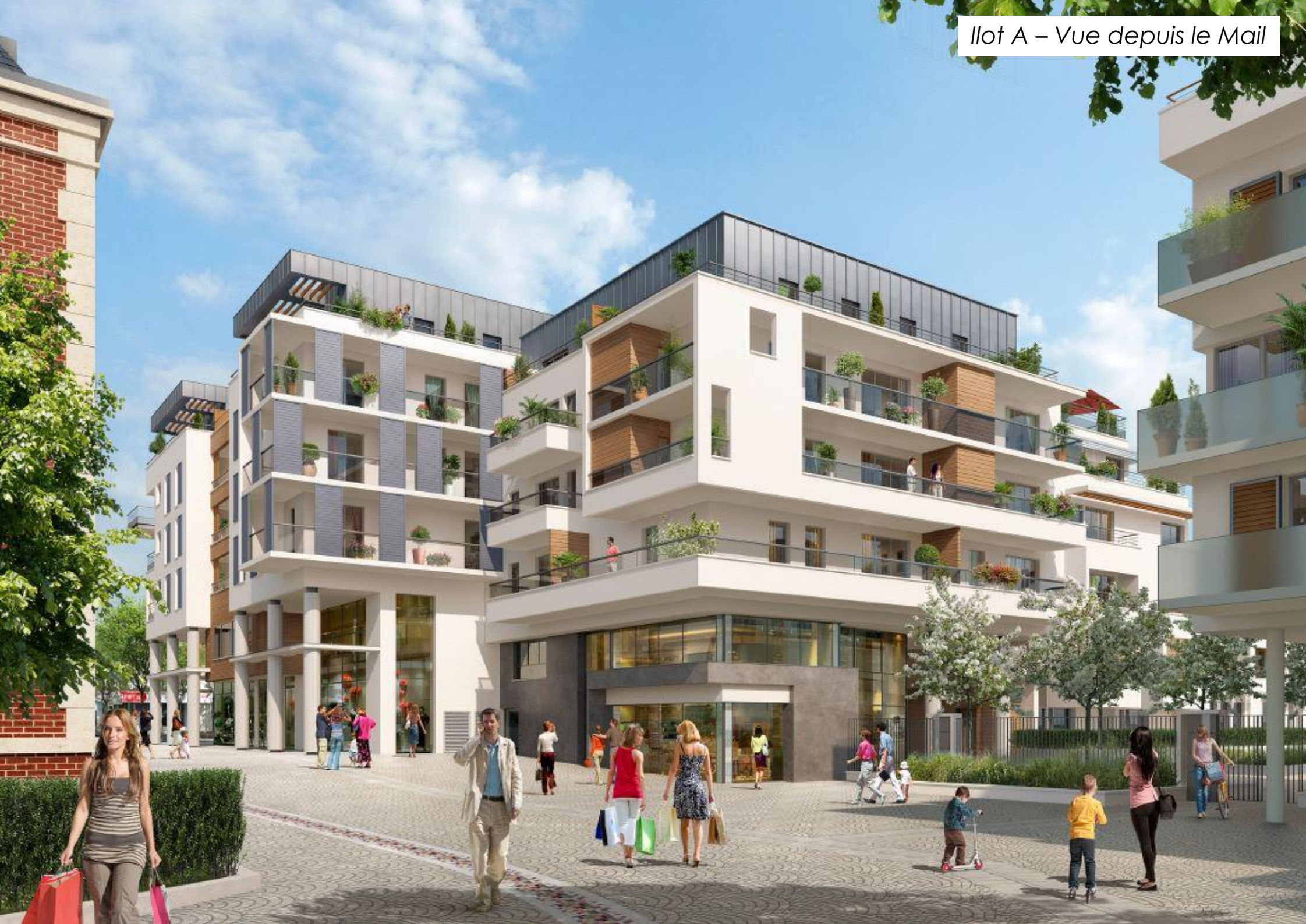
Ilôt A – Vue depuis le Mail