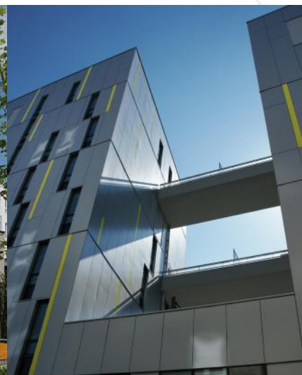
Colombes, Eco Sphère