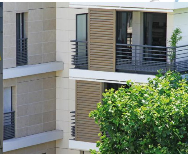
Courbevoie, Nova Square