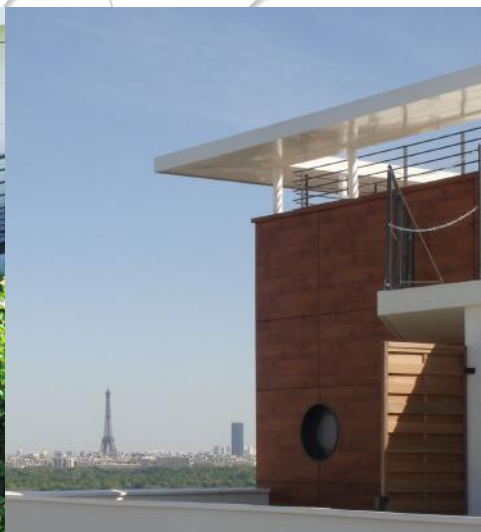
Suresnes, Villa Natura