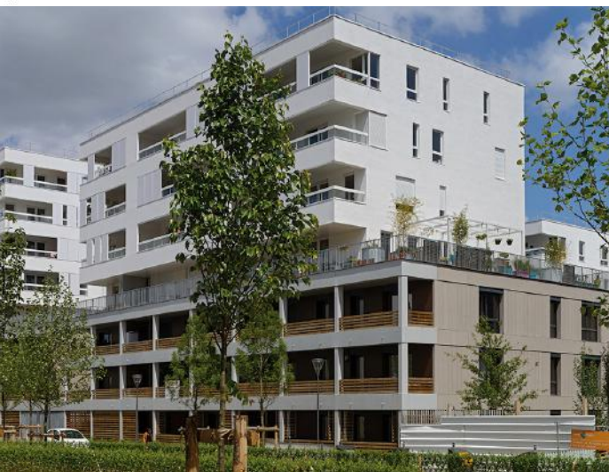
Massy, Terrasses et Jardins