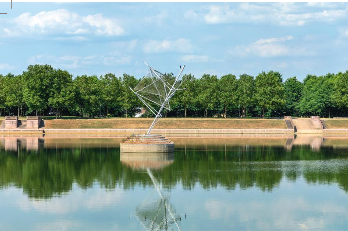
Lac de la Sourderie