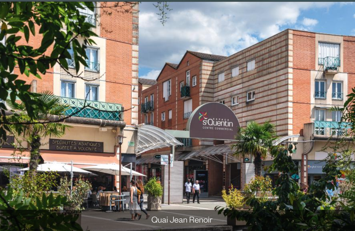
Quai Jean Renoir