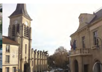
Centre ville historique