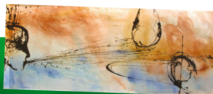
Exemple d'œuvre d'art installée à Courbevoie commandée à l'artiste Agnès Peze

Une belle façon de marquer la singularité de votre résidence !