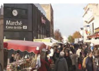
Marché du centre ville