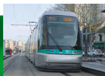
Ligne T6 à proximité