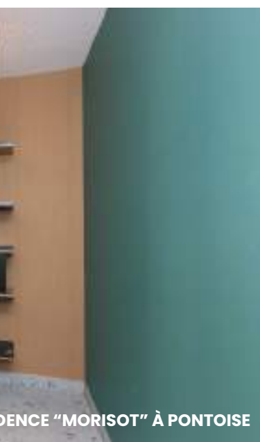
DENCE "MORISOT" À PONTOISE

Créée en 2015, la charte 1 immeuble, 1 œuvre a pour objectif d'installer l'art au plus près de chacun, dans des bâtiments privés. Chacune des résidences Interconstruction abrite 1 ou plusieurs œuvres d'art originale en véritable clin d'œil à l'histoire du lieu.