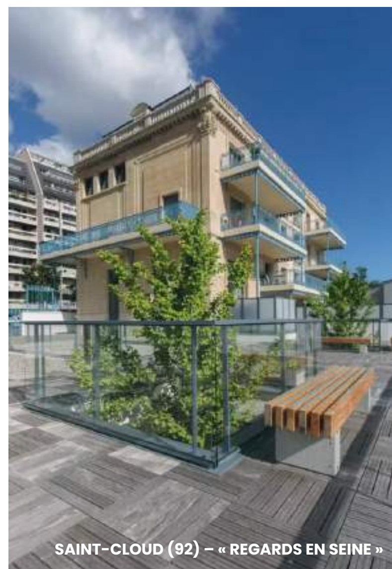
SAINT-CLOUD (92) – « REGARDS EN SEINE »