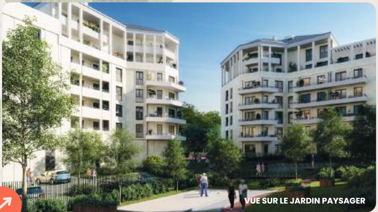
VUE SUR LE JARDIN PAYSAGER