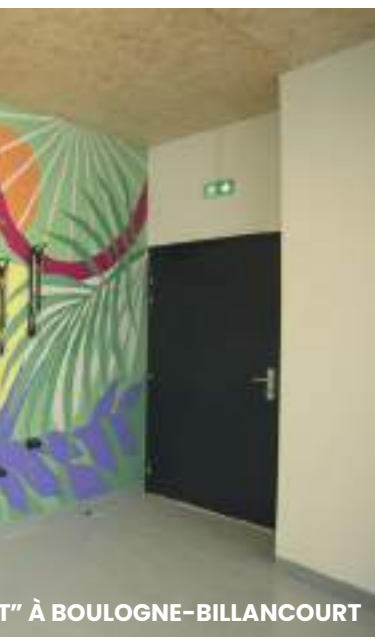
T" À BOULOGNE-BILLANCOURT