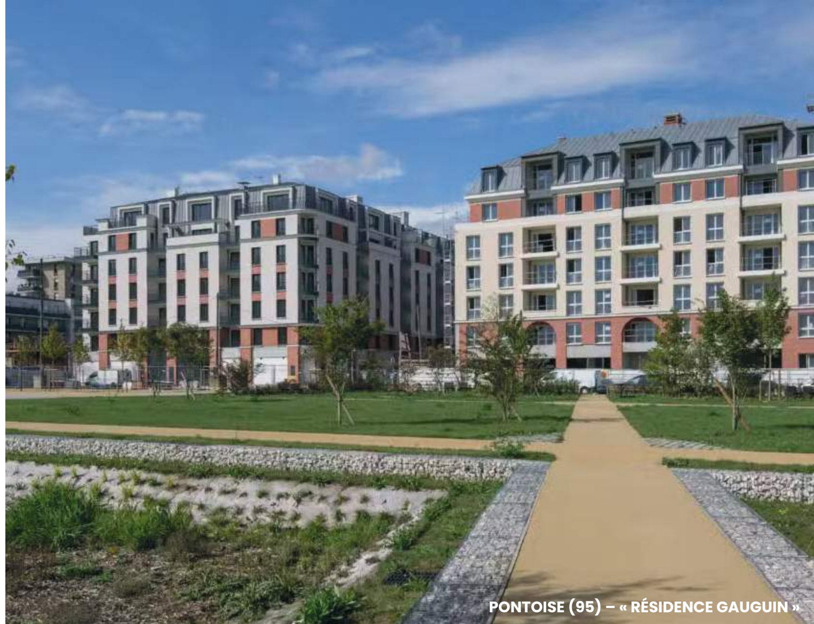
PONTOISE (95) – « RÉSIDENCE GAUGUIN »