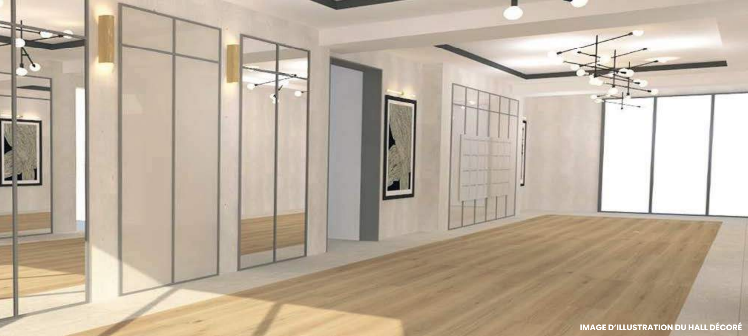
IMAGE D'ILLUSTRATION DU HALL DÉCORÉ