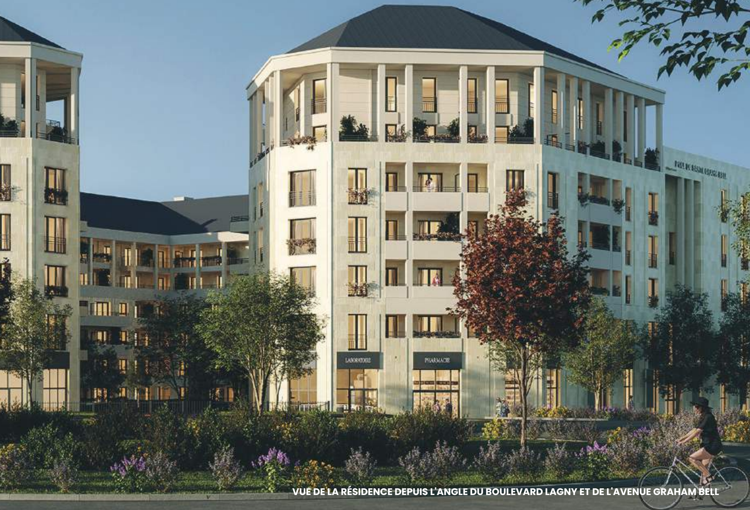
VUE DE LA RÉSIDENCE DEPUIS L'ANGLE DU BOULEVARD LAGNY ET DE L'AVENUE GRAHAM BELL

Étiquette énergétique en kWhep / m 2 / an