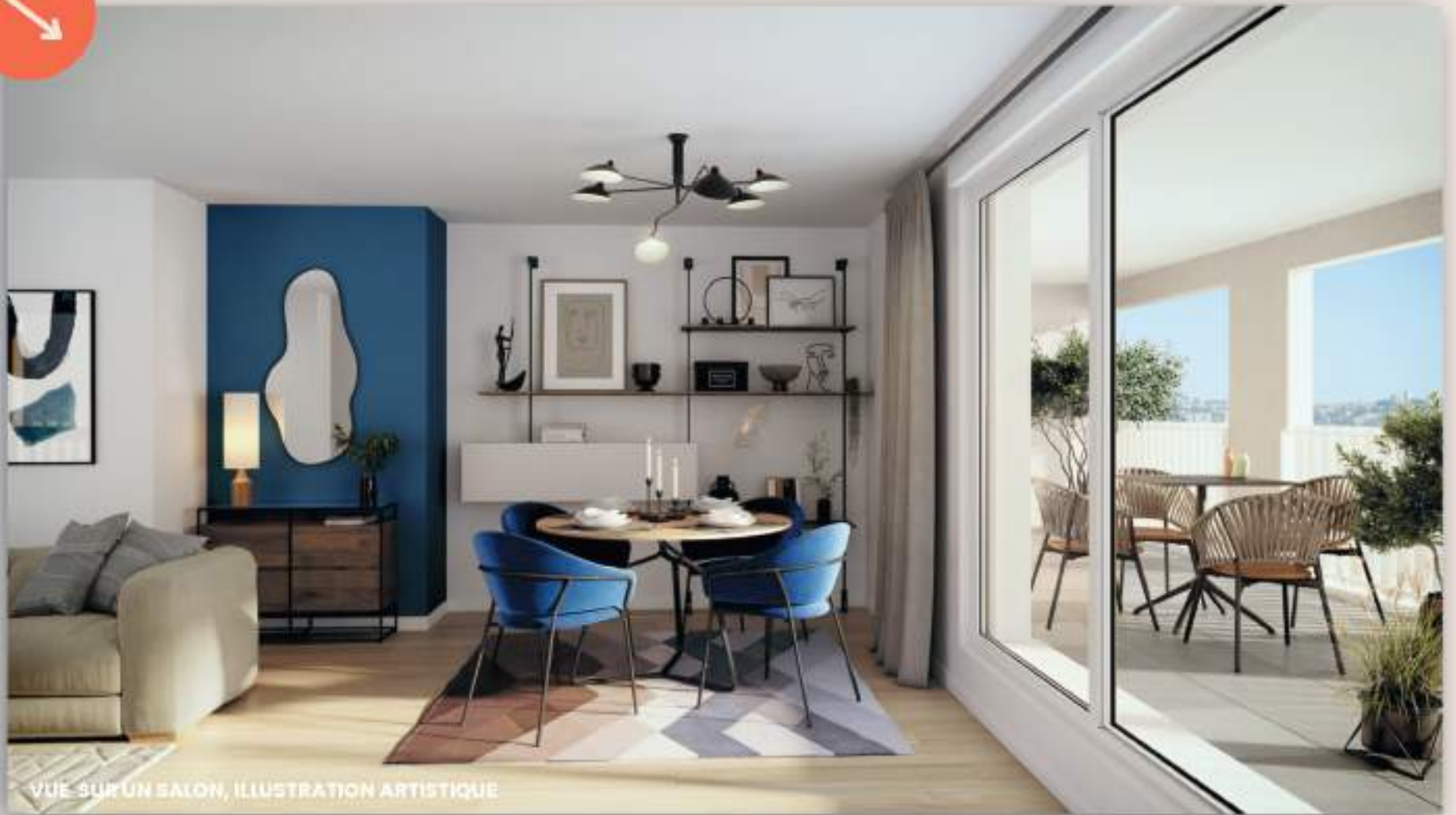
VUE SUR UN SALON, ILLUSTRATION ARTISTIQUE