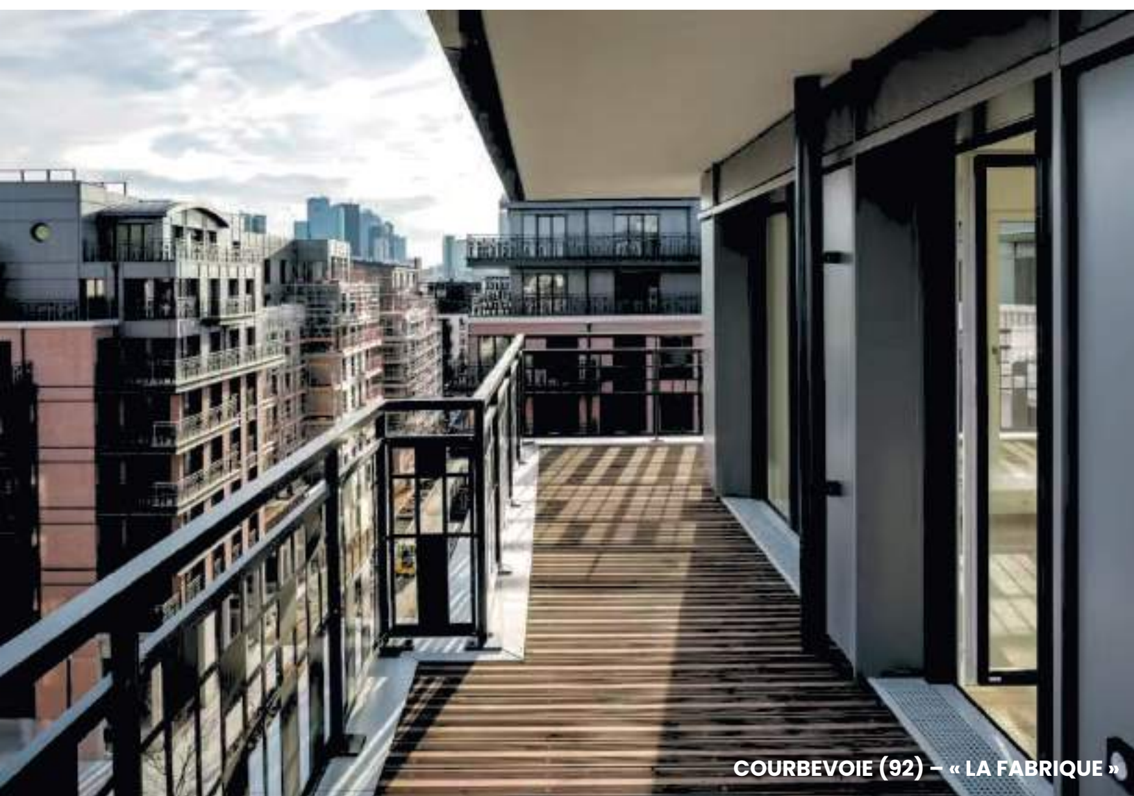
COURBEVOIE (92) – « LA FABRIQUE »