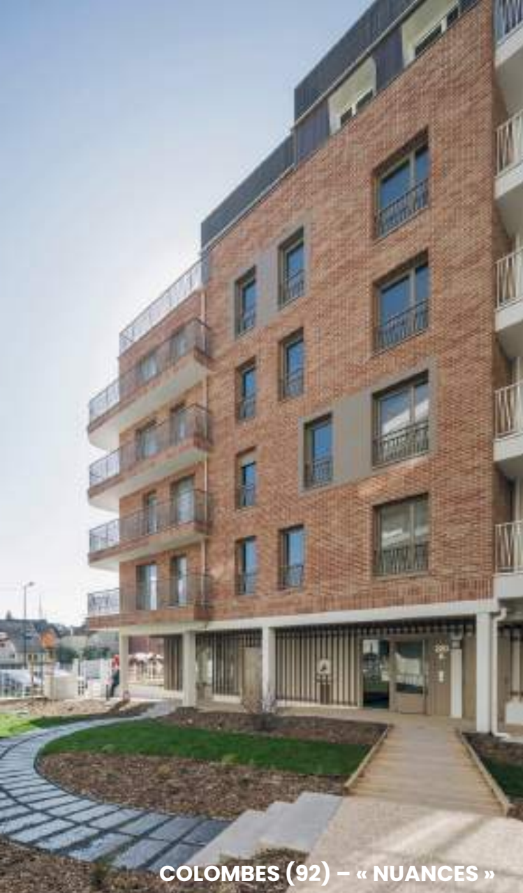
COLOMBES (92) – « NUANCES »