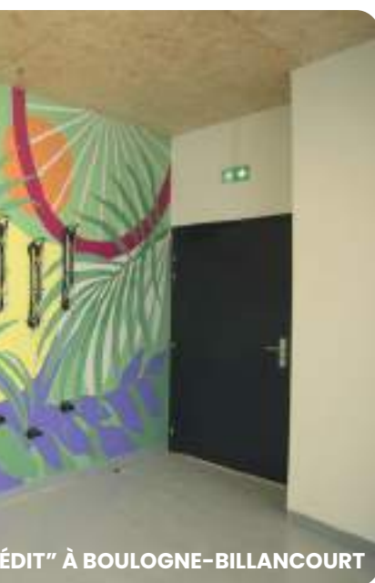
ÉDIT" À BOULOGNE-BILLANCOURT

Créée en 2015, la charte 1 immeuble, 1 œuvre a pour objectif d'installer l'art au plus près de chacun, dans des bâtiments privés. Chacune des résidences Interconstruction abrite 1 ou plusieurs œuvres d'art originale en véritable clin d'œil à l'histoire du lieu.