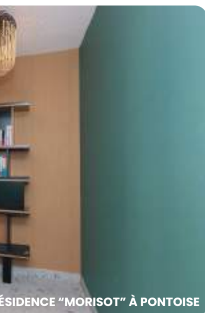
ÉSIDENTE "MORISOT" À PONTOISE