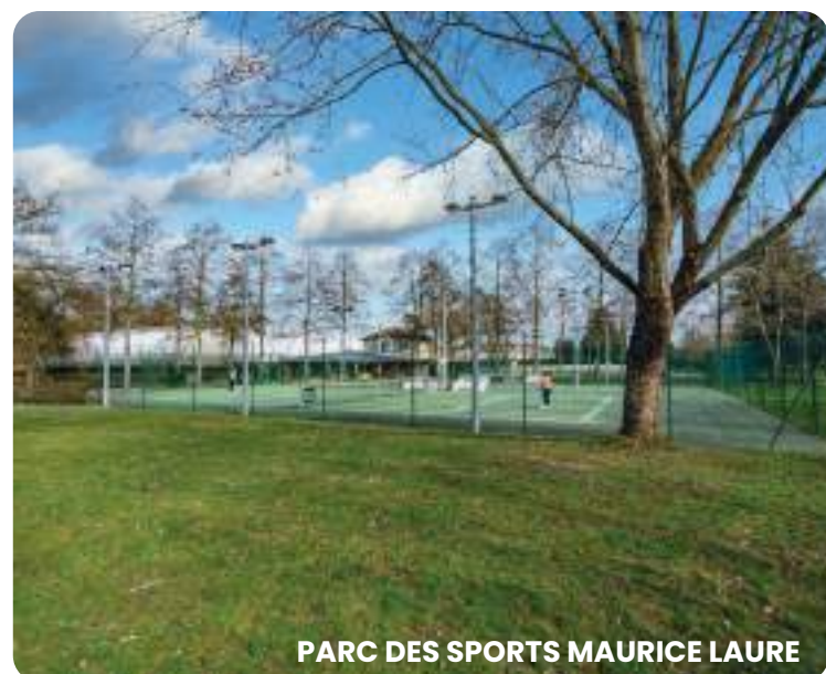
PARC DES SPORTS MAURICE LAURE

Nombreux équipements culturels : médiathèque, salle de spectacle, lieux d'exposition, espace musical, école de musique, centre socio-culturel, studios d'enregistrement