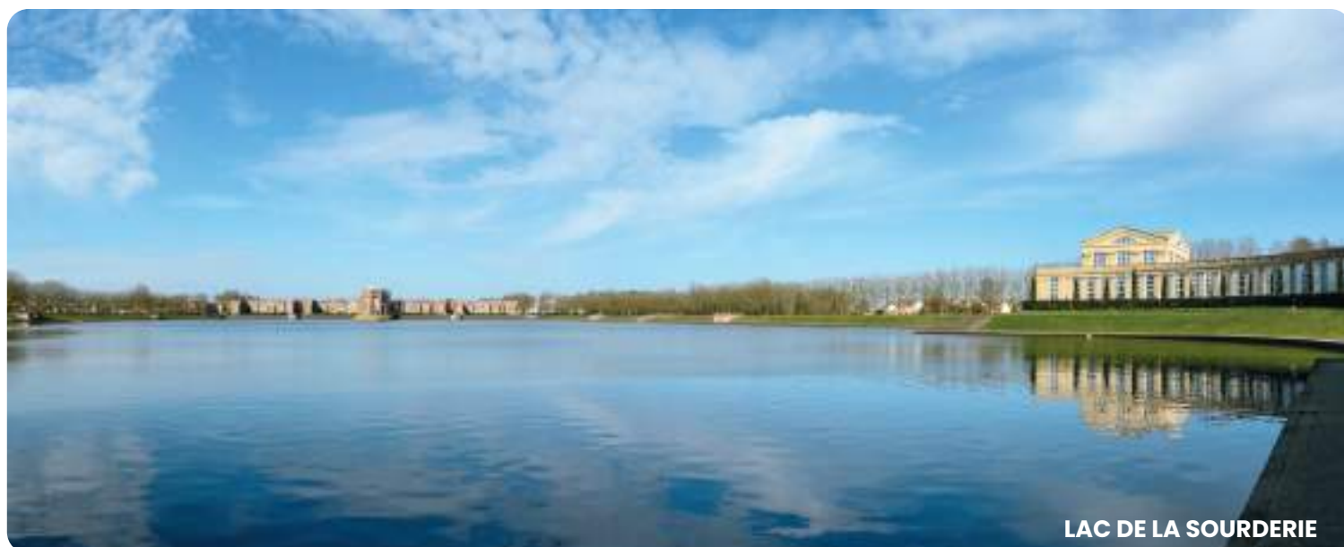
LAC DE LA SOURDERIE