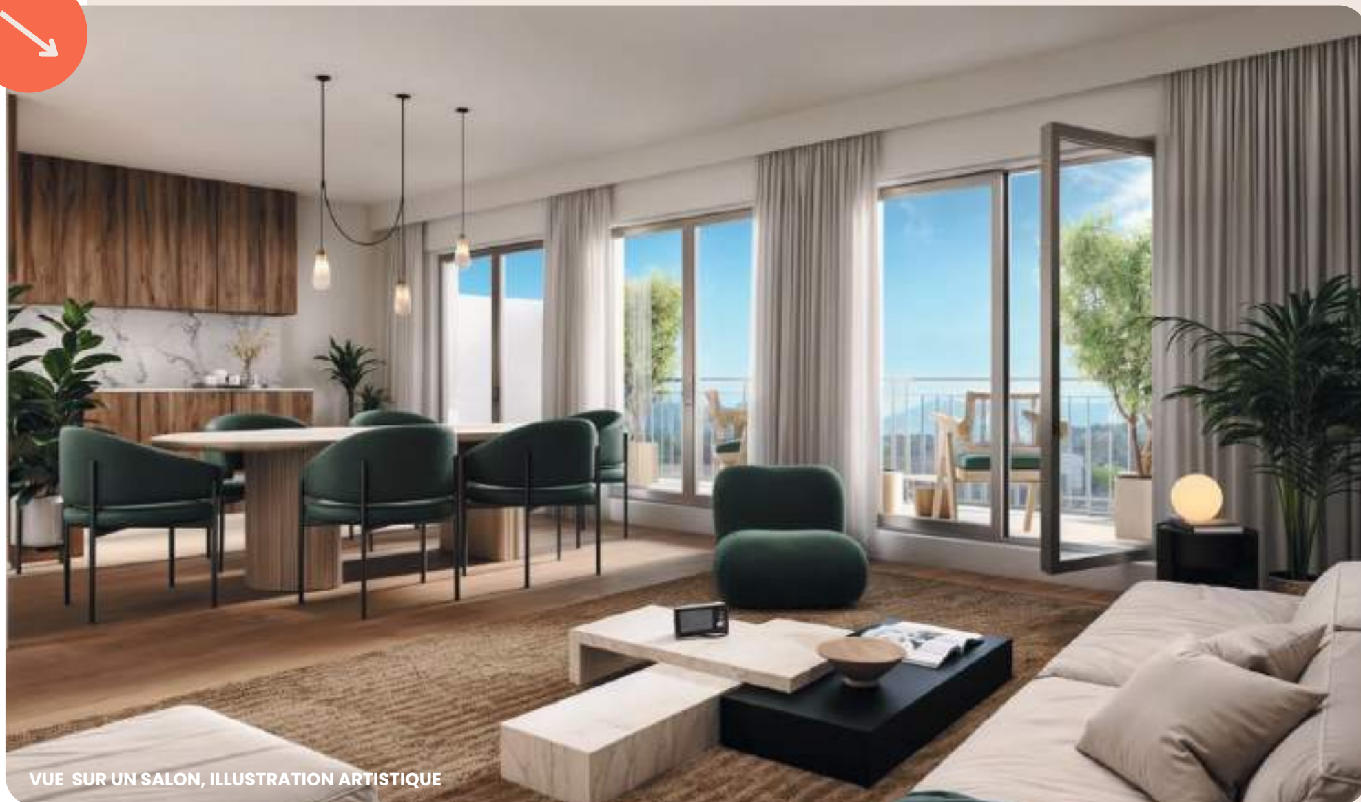
VUE SUR UN SALON, ILLUSTRATION ARTISTIQUE