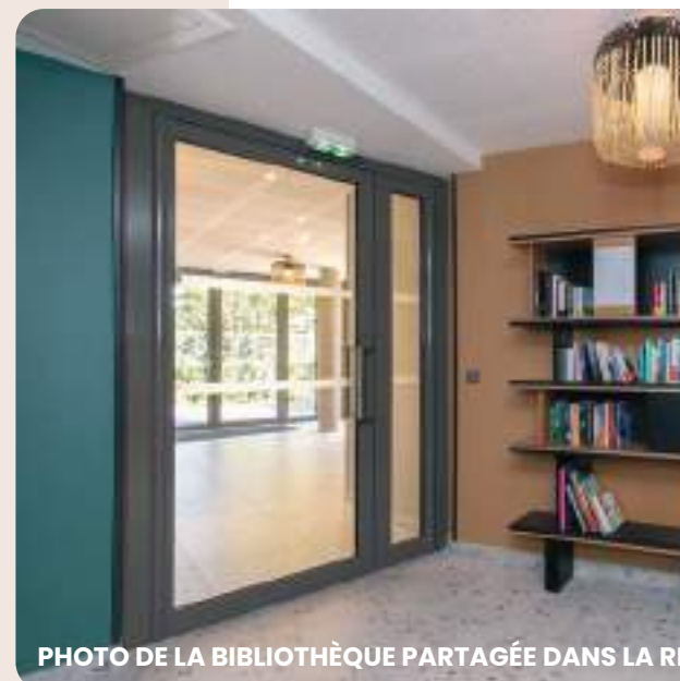
PHOTO DE LA BIBLIOTHÈQUE PARTAGÉE DANS LA R