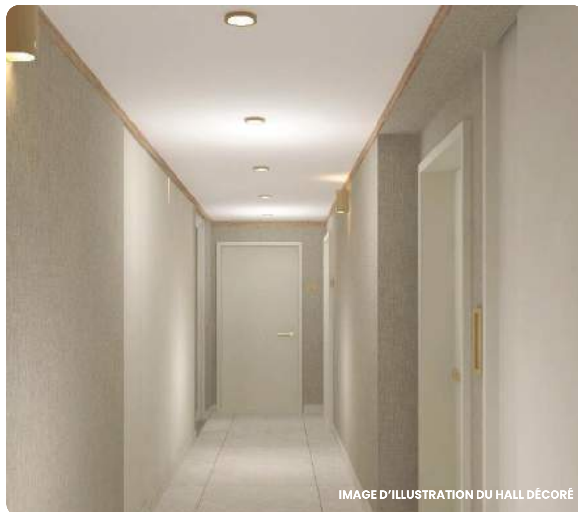
IMAGE D'ILLUSTRATION DU HALL DÉCORÉ