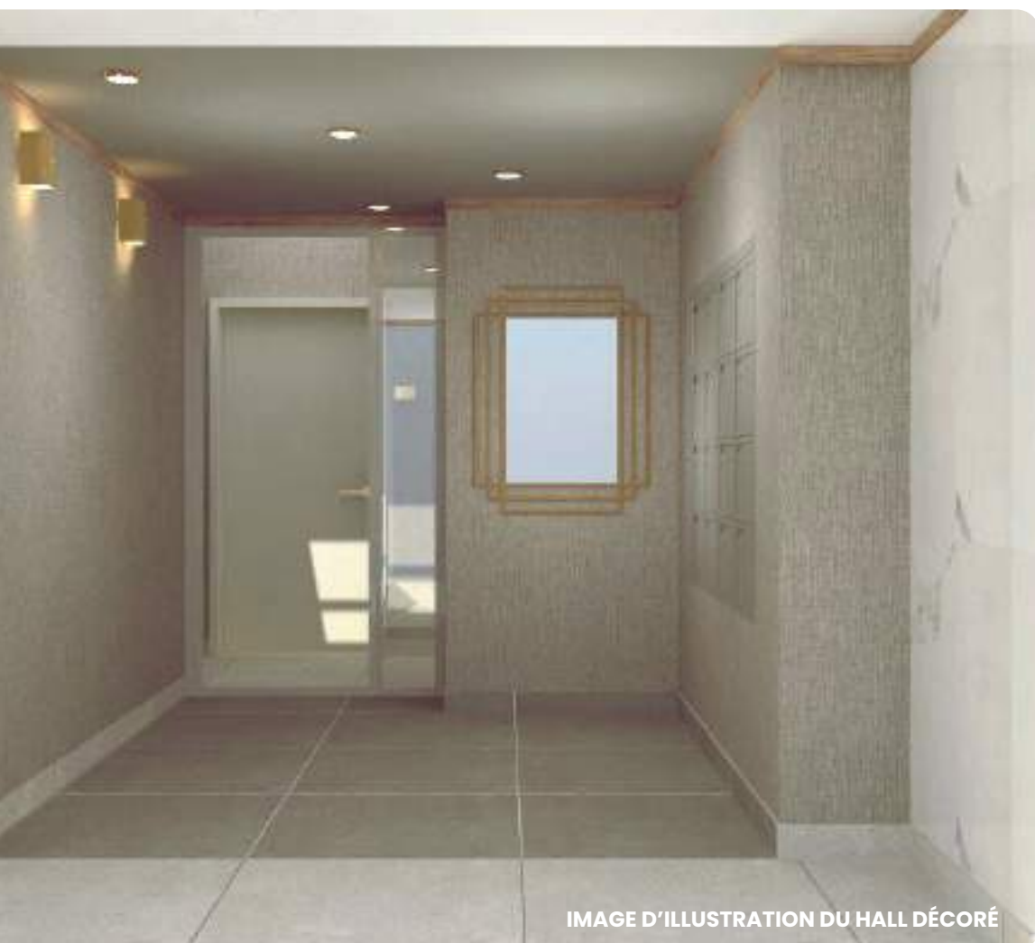
IMAGE D'ILLUSTRATION DU HALL DÉCORÉ