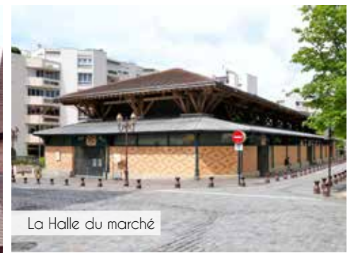
La Halle du marché